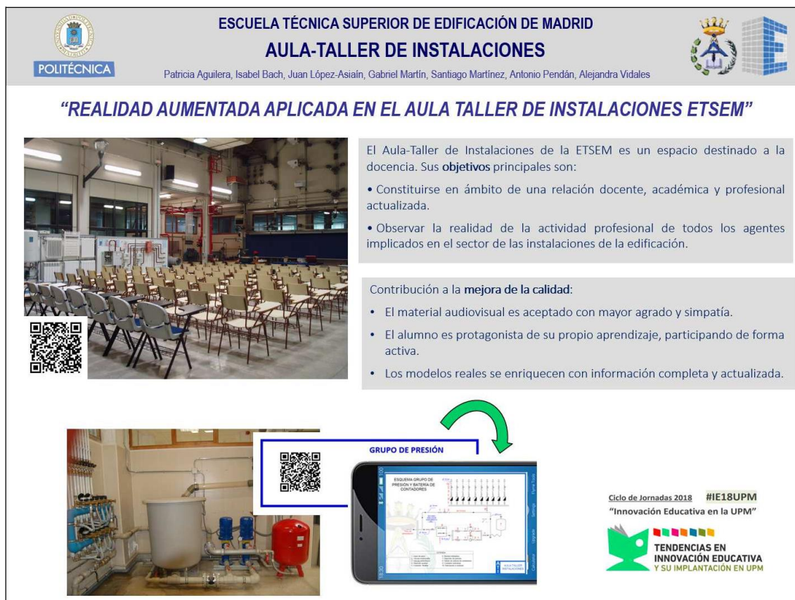
Fig. Póster presentado en las JORNADAS ie18UPM

El Aula Taller participó en las Jornadas del Programa 4º de ESO + EMPRESA realizadas en la ETSEM, celebradas del 8 al 12 de abril de 2018. Dichas jornadas son coordinadas por el Vicerrectorado de Alumnos y EU dentro del Proyecto de Promoción de Vocaciones Tecnológicas. En la labor de orientar a los alumnos, se realizó una visita guiada por los simuladores adaptada a su nivel académico y una propuesta de trabajo en base a la realización de contenidos gamificados con el servicio web de educación social Kahoot.