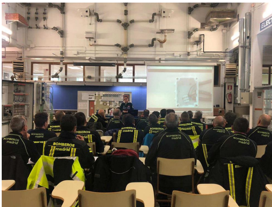
Fig. Curso Bomberos del Ayuntamiento de Madrid

La apuesta del Aula Taller para servir de puente entre la formación académica y la actuación profesional del Arquitecto Técnico se materializa en la organización de jornadas técnicas con firmas comerciales del sector, como complemento a la docencia y en el ánimo de establecer una relación directa entre contenidos docentes y ámbito comercial.