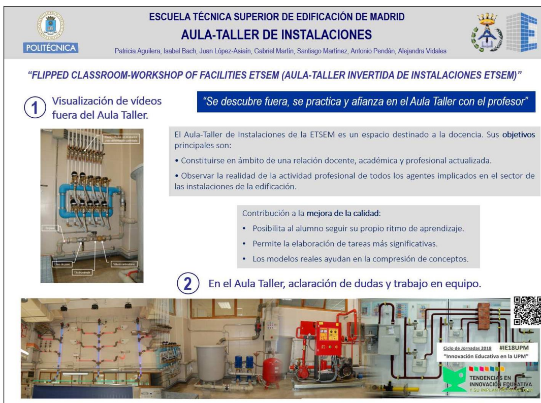
Fig. Póster presentado en las JORNADAS ie18UPM

Estos proyectos han permitido iniciar la realización de diversos vídeos educativos, así como la señalización de simuladores y maquetas con realidad aumentada en forma de códigos QR.